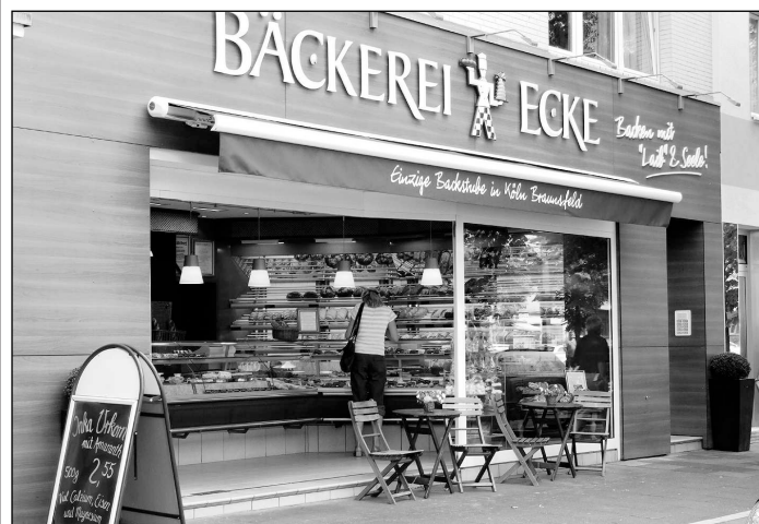
■ Seit der Firmengründung im Jahr 1903 befindet sich die Bäckerei Ecke an der Aachener Straße 517 in Braunsfeld.