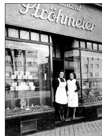
■ Die Bäckerei Ecke in den 60er Jahren.